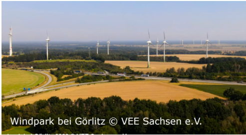
Windpark bei Görlitz

BEREICH: Windkraft & Repowering KLASSENSTUFE: ab Klasse 7 ZIEL: Kennenlernen der Windkraft, kreative Planung, Ideenpräsentation DAUER: etwa 2 Unterrichtseinheiten á 45 min ERSTELLUNGSJAHR: 2023